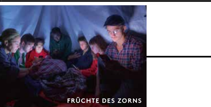
FRÜCHTE DES ZORNS