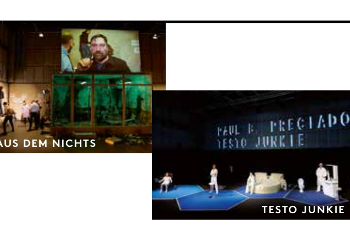
AUS DEM NICHTS