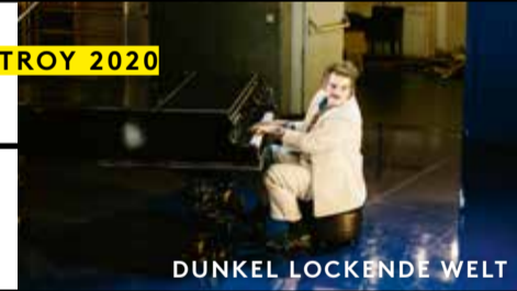
DUNKEL LOCKENDE WELT