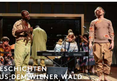
GESCHICHTEN AUS DEM WIENER WALD